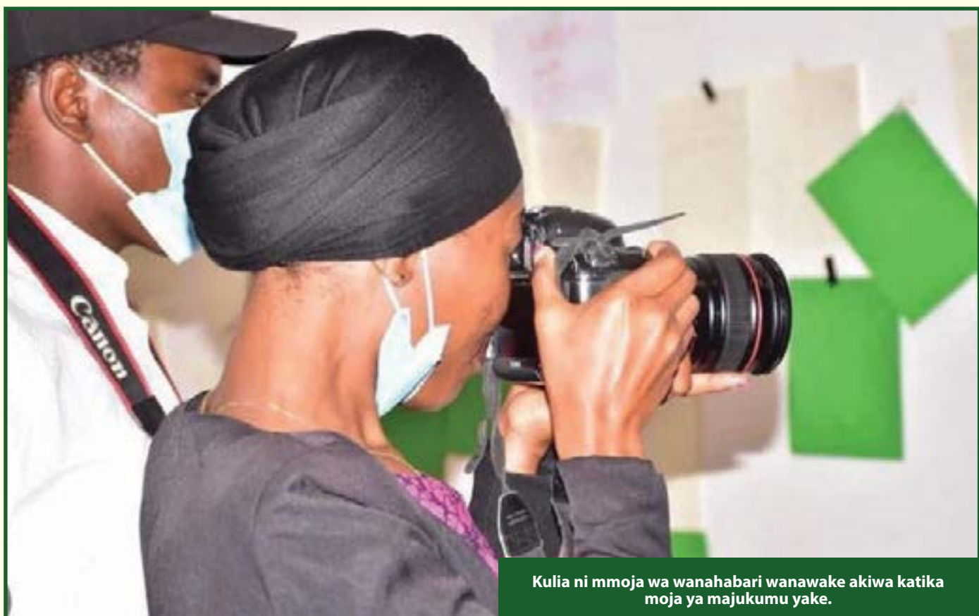
Kulia ni mmoja wa wanahabari wanawake akiwa katika moja ya majukumu yake.