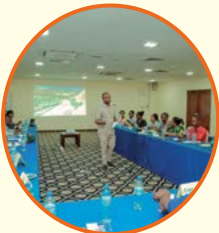
Mafunzo kwa wahariri, wamiliki wa vyombo vya habari, mameneja, na wanahabari wanawake, Mkoa wa Dar Es Salaam.

Mijadala mbalimbali iliyoendeshwa na TAMWA kwa kushirikiana na wadau wa masuala ya kijinsia, Serikali na vyombo vya habari katika harakati za kupinga rushwa ya ngono ndani ya vyombo vya habari.