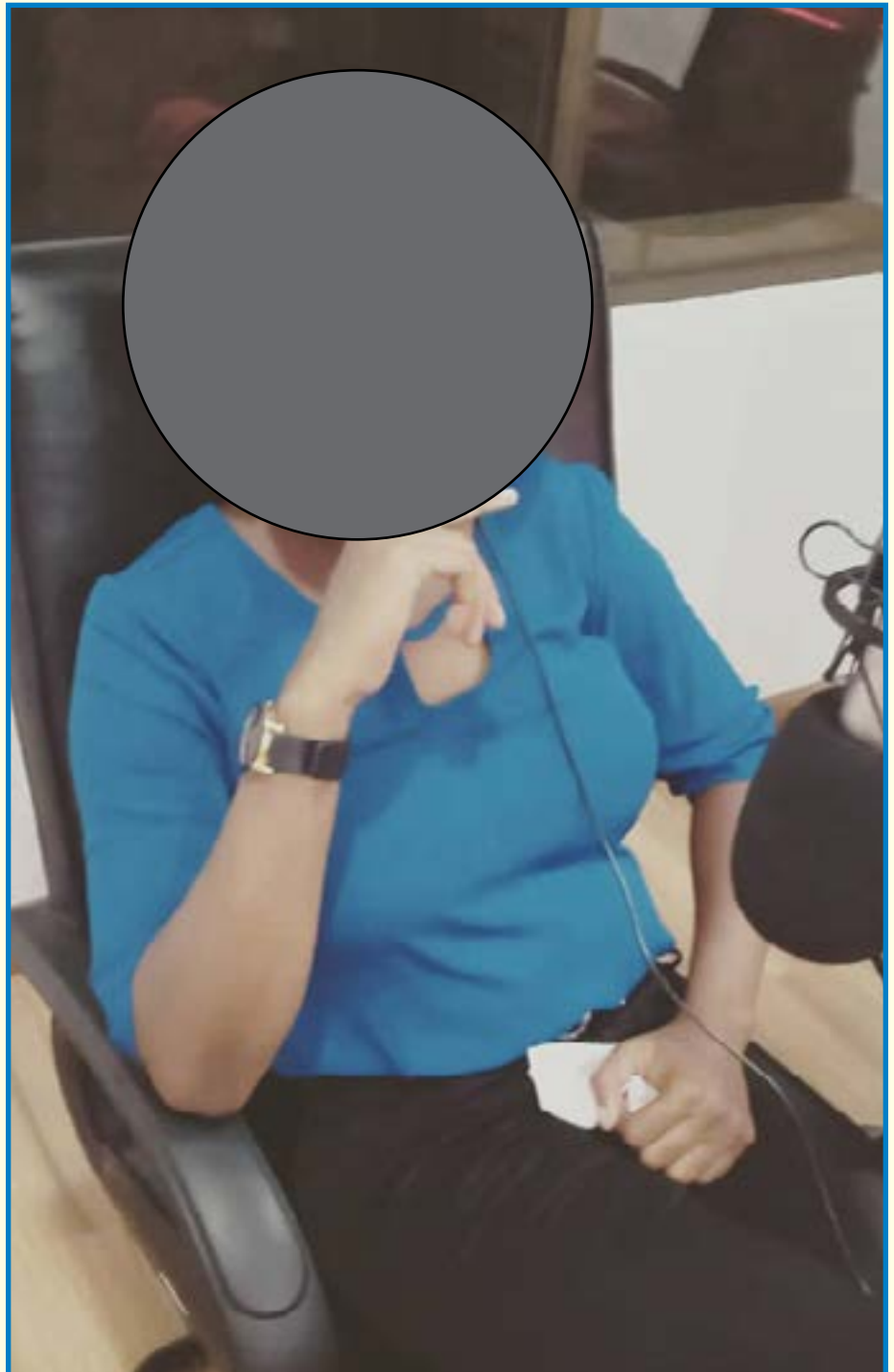
Mmoja wa wahanga wa rushwa ya ngono ndani ya vyombo vya habari (jina limehifadhiwa)