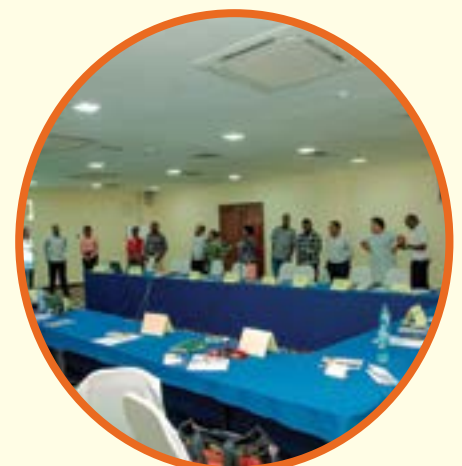
Mdahalo wa wahariri, wamiliki wa vyombo vya habari, mameneja, na wanahabari wanawake, Mkoa wa Dar es Salaam.