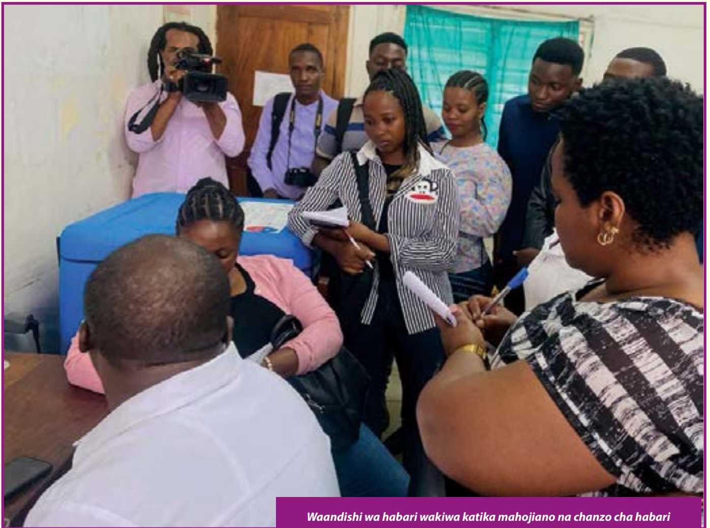
Waandishi wa habari wakiwa katika mahojiano na chanzo cha habari

Waandishi wa habari wanawake tunaofanya kazi kwa kujitolea tukisubiri nafasi za ajira tunapitia mateso mengi kwasababu tunapitia mitego mingi ya rushwa ya ngono", anasema mwanahabari mwanamke Nangasu Majidy (si jina halisi) mwenye umri wa miaka 28.