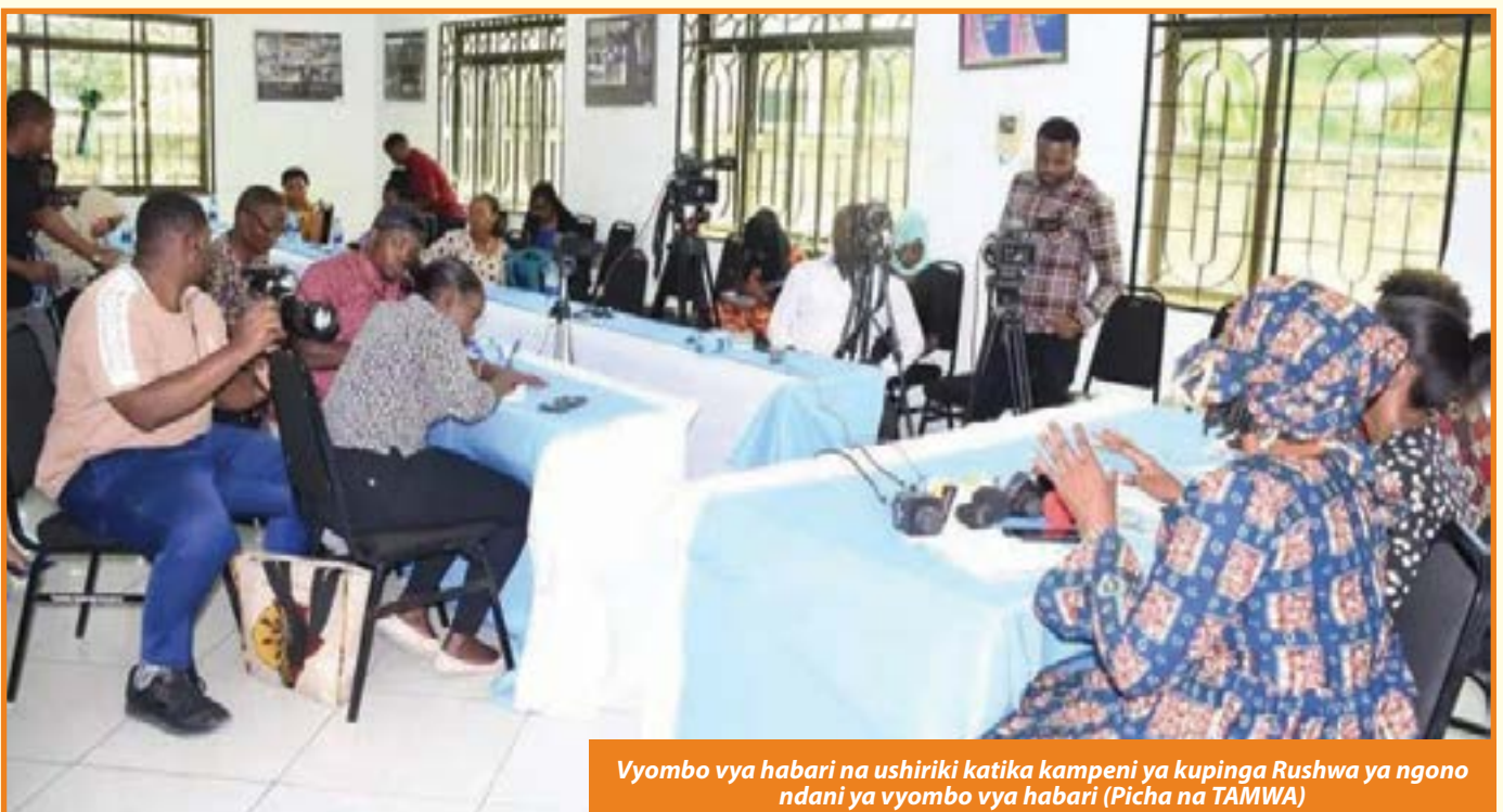
Vyombo vya habari na ushiriki katika kampeni ya kupinga Rushwa ya ngono ndani ya vyombo vya habari

Kwenye vyumba vya habari, waandishi wa habari wanawake wanakumbana na rushwa ya ngono wanapokwenda kufanya kazi kwa vitendo wakiwa bado vyuoni, wanapoamua kwenda kujitolea wakisubiri kupata ajira baada ya kumaliza vyo au wanapokuwa wameajiriwa. ▶ Uk 9