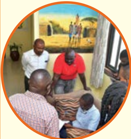
Majadiliano na wanahabari wanaume, Mkoa wa Dar es Salaam.

Mijadala mbalimbali iliyoendeshwa na TAMWA kwa kushirikiana na wadau wa masuala ya kijinsia, Serikali na vyombo vya habari katika harakati za kupinga rushwa ya ngono ndani ya vyombo vya habari.