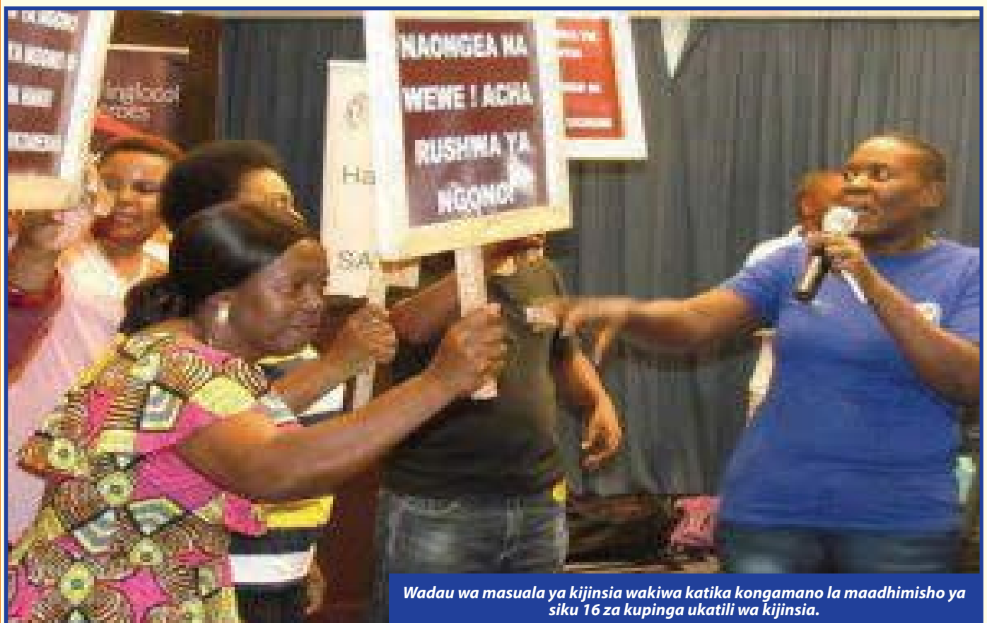
Wadau wa masuala ya kijinsia wakiwa katika kongamano la maadhimisho ya siku 16 za kupinga ukatili wa kijinsia.

“Zawadi anasema dada J alimwambia “kwa kifupi wanachofanya ni kukuchezea, siku isiyo najina utakuja kujutia hiki unachokifanya, utaondolewa kwaibu, acha hicho unachokifanya, tulia wewe ni binti mrembo, usitumie uzuri wako vibaya”. ▶ Uk 21