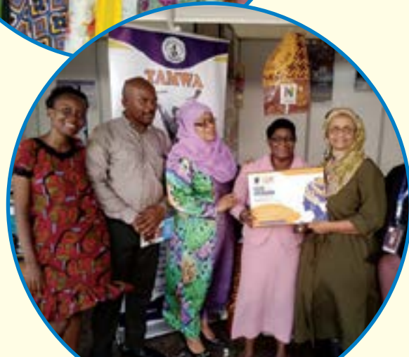
TAMWA ilipoungana na TGNP katika kusherehekea miaka 30 ya taasisi hiyo yaliyoambatana na Tamasha La Jinsia la 15 lililofanyika Novemba 7-10, 2023 katika viwanja ya TGNP, jijini Dar Es Salaam.